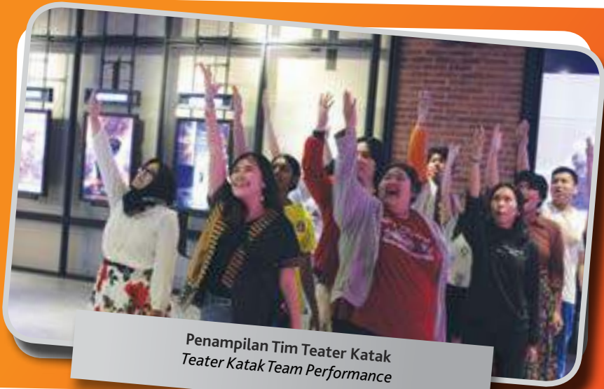
Penampilan Tim Teater Katak Teater Katak Team Performance