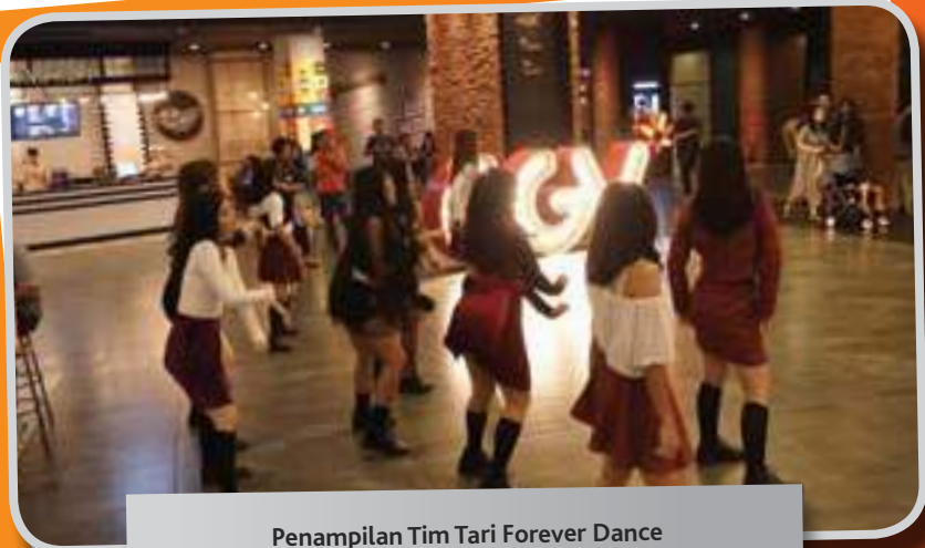
Penampilan Tim Tari Forever Dance Forever Dance Dancing Team Performance