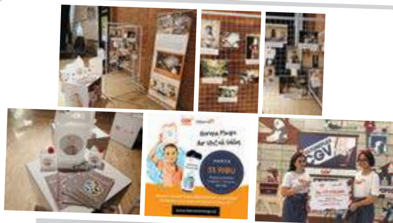
Dukungan untuk kampanye Berani Mimpi untuk Air Bersih Sikka (WVI) Support for Berani Mimpi untuk Air Bersih (Dare to Dream for Clean Water) Sikka Campaign (WVI)

In this cooperation program, the Company provides Point of Sales space for the Foundation's merchandise where the Company also provides communication channel for the sales promotion such as screen ads, LCD ads, booth P as well as online and offline communication platforms in the Company.