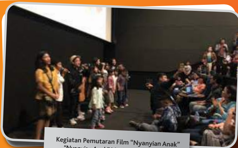
Kegiatan Pemutaran Film "Nyanyian Anak" "Nyanyian Anak" Movie Screening Event