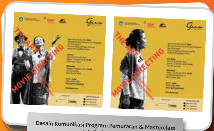
Desain Komunikasi Program Pemutaran & Masterclass oleh Garin Nugroho Communication Design for Movie Screening & Masterclass by Garin Nugroho