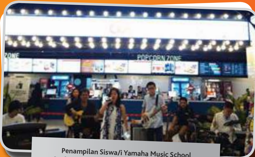
Penampilan Siswa/i Yamaha Music School Performance from Yamaha Music School Students

On the other hand, the Company also held "Paint For A Cause," a painting workshop and exhibition, where the participants can give their donation while learning to paint. The Company cooperates with Kala Arts and SOS Children's Indonesia as fund channeling foundation.