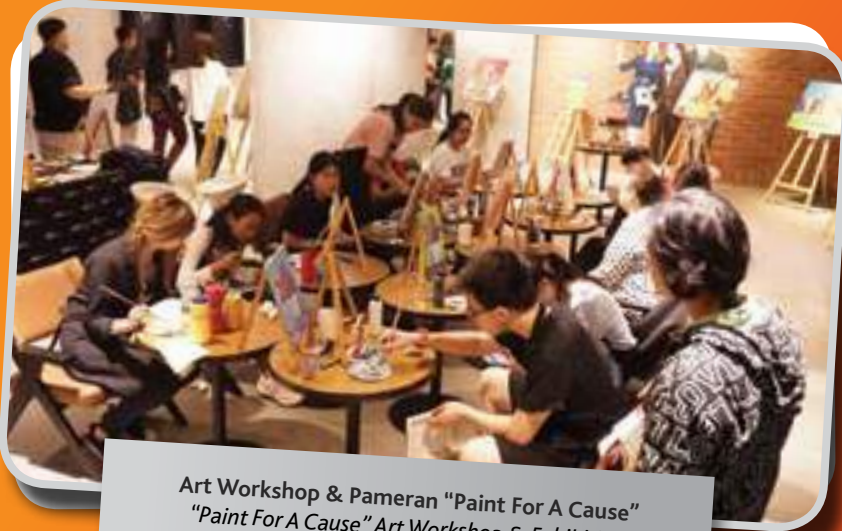
Art Workshop & Pameran "Paint For A Cause" "Paint For A Cause" Art Workshop & Exhibition