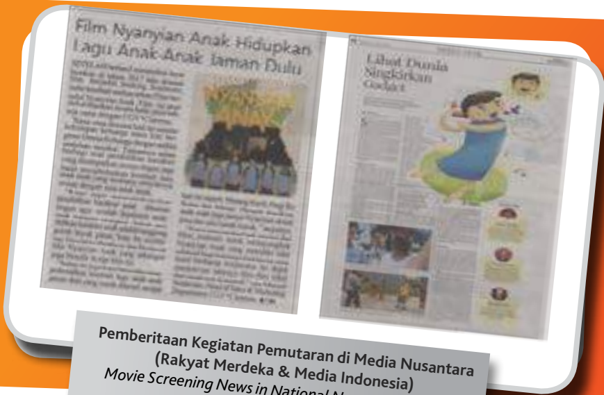
Pemberitaan Kegiatan Pemutaran di Media Nusantara (Rakyat Merdeka & Media Indonesia) Movie Screening News in National Newspaper (Rakyat Merdeka & Media Indonesia)