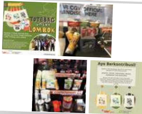
Dukungan untuk kampanye Buka Jendela Dunia Untuk Lombok (GNI) Support for Buka Jendela Dunia Campaign For Lombok (GNI)